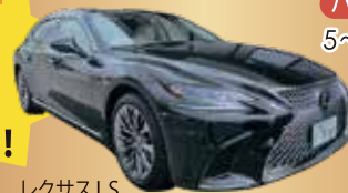
レクサスLS エグゼクティブ

オプション:ハイヤープラン ご自宅から 貴方のグループだけ 金沢港まで 貸切ハイヤーでご送迎!