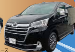
グランエース プレミアム

「海上のイタリア」がコンセプトの豪華客船で行く特別感満載の5日間! 金沢港発着 韓国・釜山豪華クルーズ