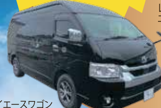
ハイエースワゴン グランドキャビン

5~8名様利用 お一人様 10,000円 4名様利用 お一人様 13,000円 3名様利用 お一人様 17,000円 2名様利用 お一人様 25,000円